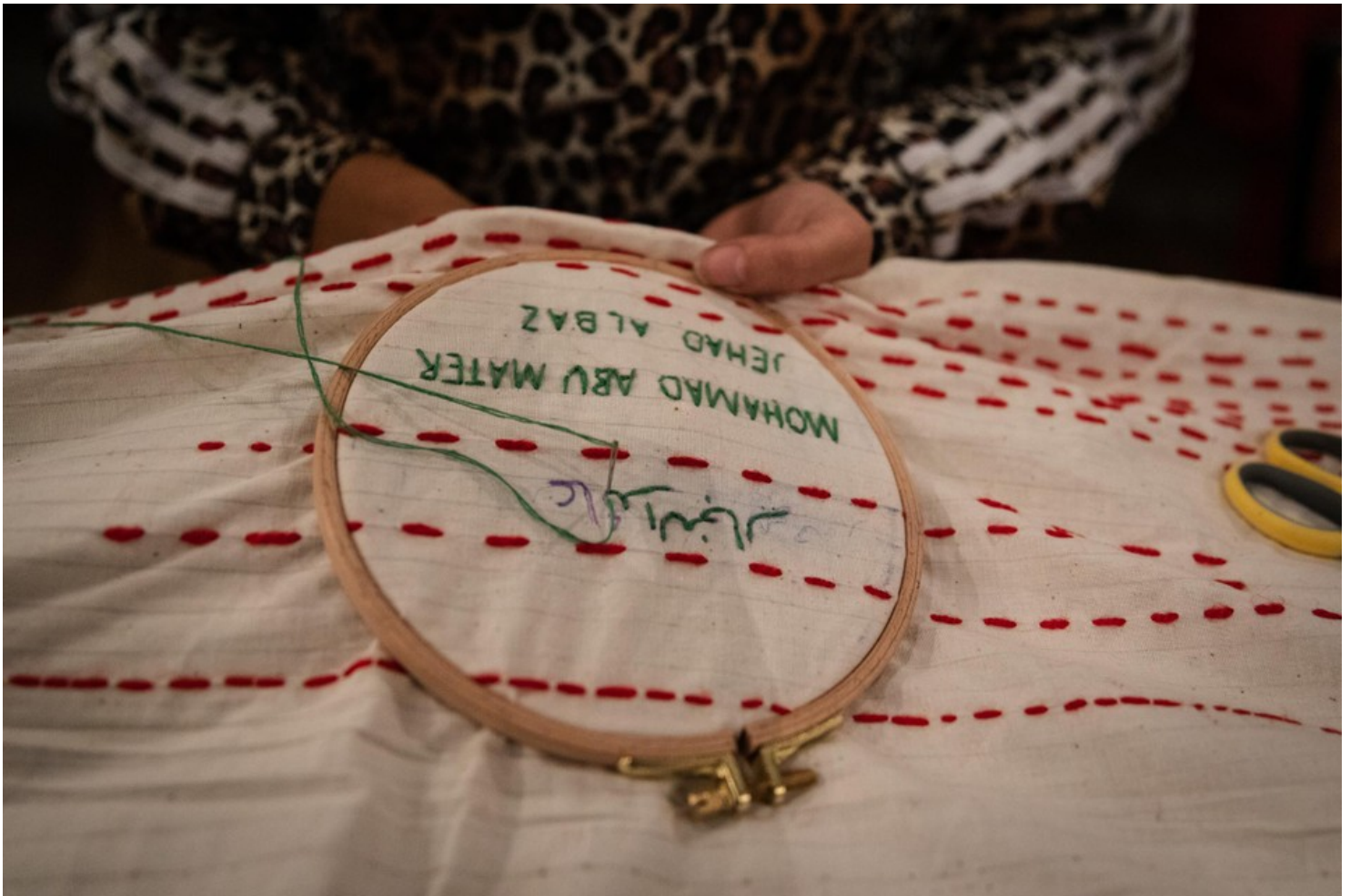
Het Palestina Café in Gent: een ‘hearing and healing space’.